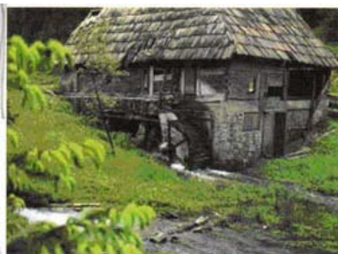
Virtuelles Bild der Vitz-Mühle