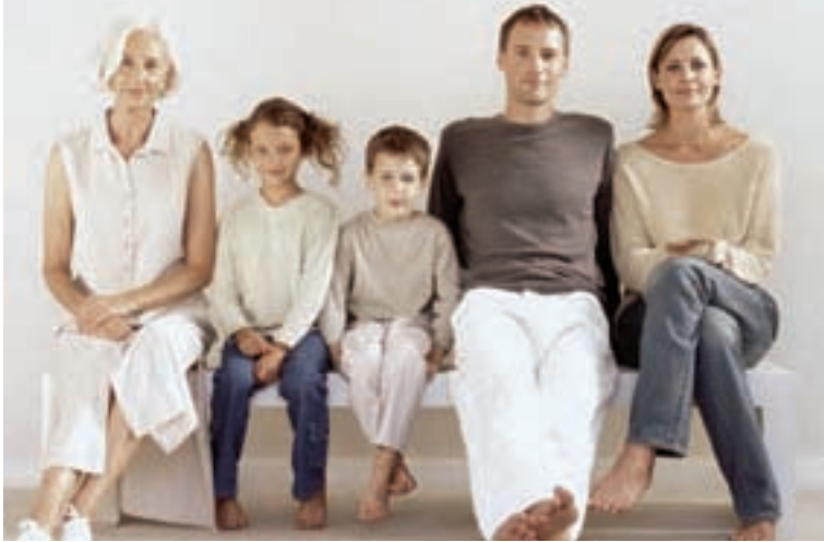
Ob Großfamilie oder Zwei-Personen-Haushalt, Ruhrpower-Pakete gibt es für alle Schwerter.

Treue verdient Anerkennung – und die eine oder andere Gratifikation. So hat Ruhrpower rechtzeitig zum Jahreswechsel Pakete geschnürt, mit denen die Treue der Kunden in klingender Münze belohnt wird.