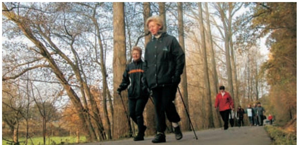
Die Nordic Walking-Kurse der SG Eintracht Ergste erfreuen sich immer größerer Beliebtheit.