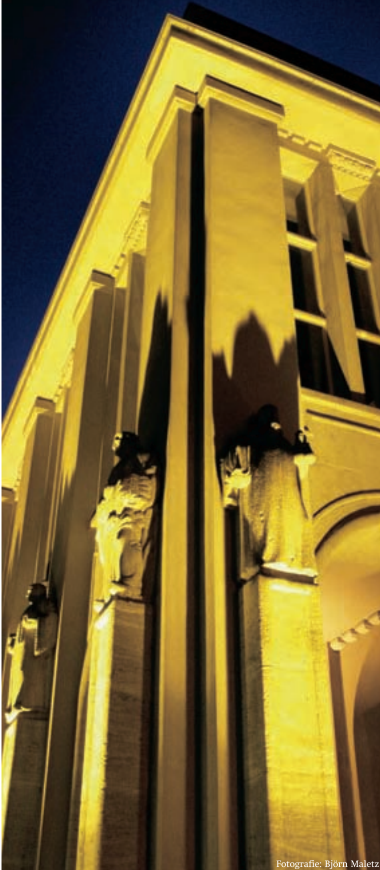
Das Schwerter Rathaus.