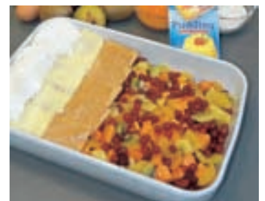
Die Zutaten auf einen Blick