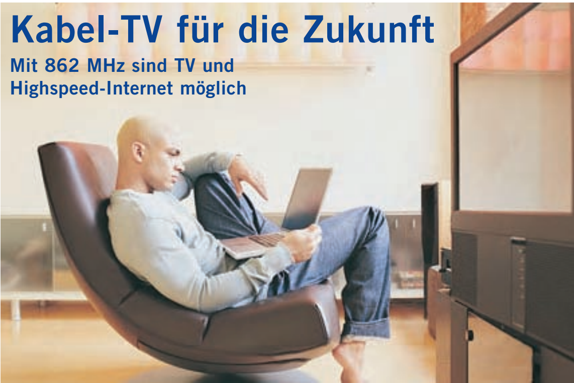
PC, Notebook oder Telefonanlagen – in einer gar nicht fernen Zukunft werden all diese Geräte von einem 862-MHz-Breitbandkabel gespeist.

Mit 862 MHz sind TV und Highspeed-Internet möglich