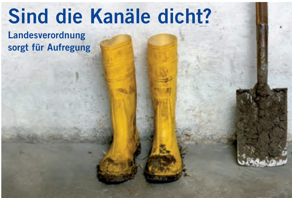
Lieber jetzt eine Dichtheitsprüfung, bevor das Wasser im Keller steht

Die Frist für die Überprüfung läuft für viele Schwerter im nächsten Jahr ab.