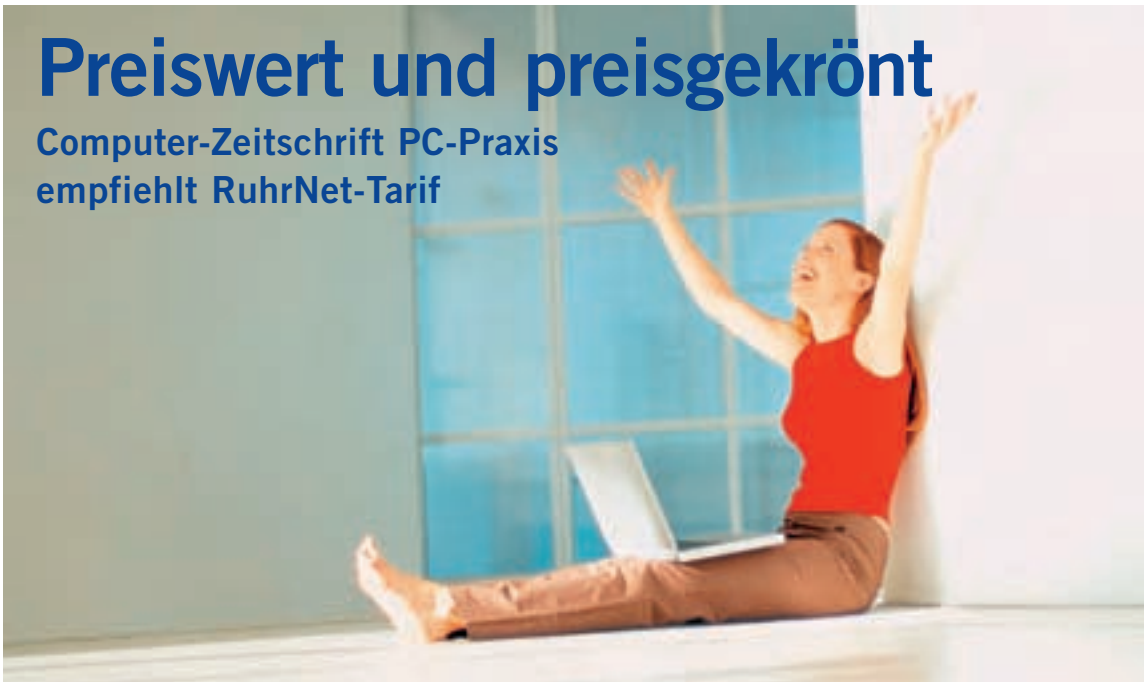
Aus vielen Haushalten nicht mehr wegzudenken, der Computer für das Internet

Computer-Zeitschrift PC-Praxis empfiehlt RuhrNet-Tarif