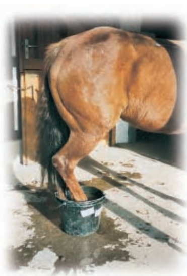
2. Preis einen HP ScanJet 5500 C gewinnt Michaela Demuth