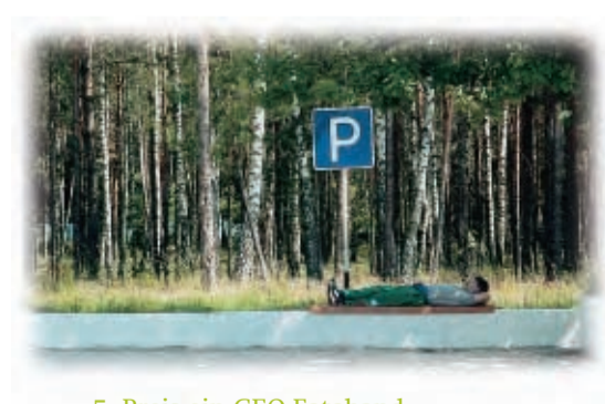
5. Preis ein GEO-Fotoband gewinnt Brigitte Menzel

Alle weiteren Einsendungen können unter www.ruhrpower.de bestaunt werden.