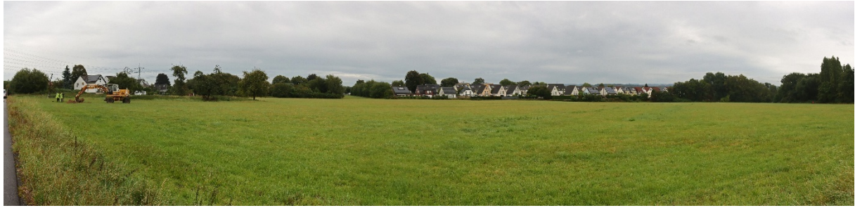
Urgelände Blickrichtung NO-SO, v. l. n. r. (LWL-AfW/T. Poggel)