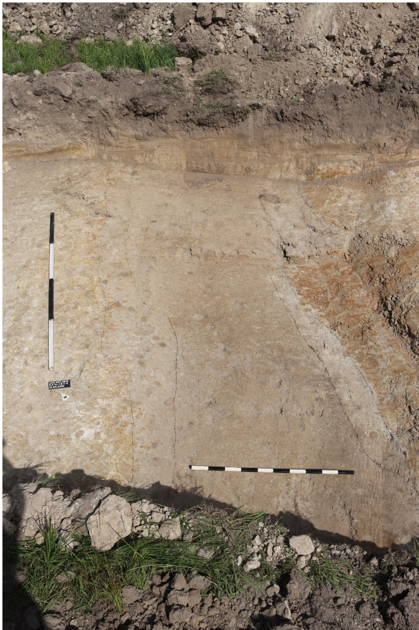
S3 P11 B1-3, Blickrichtung NO

Innerhalb von diesem Horizont wurde ein weiteres Sediment erfasst (4), welches homogen rötlich und schwach tonig/schluffig war, keinen Gesteinsanteil, keine Ca-/Fe-Ausfällungen und auch keine Kulturzeiger besaß, dafür Mn-Ausfällungen; seine Mächtigkeit betrug (im Profil sichtbare) ca. 0,06 m.