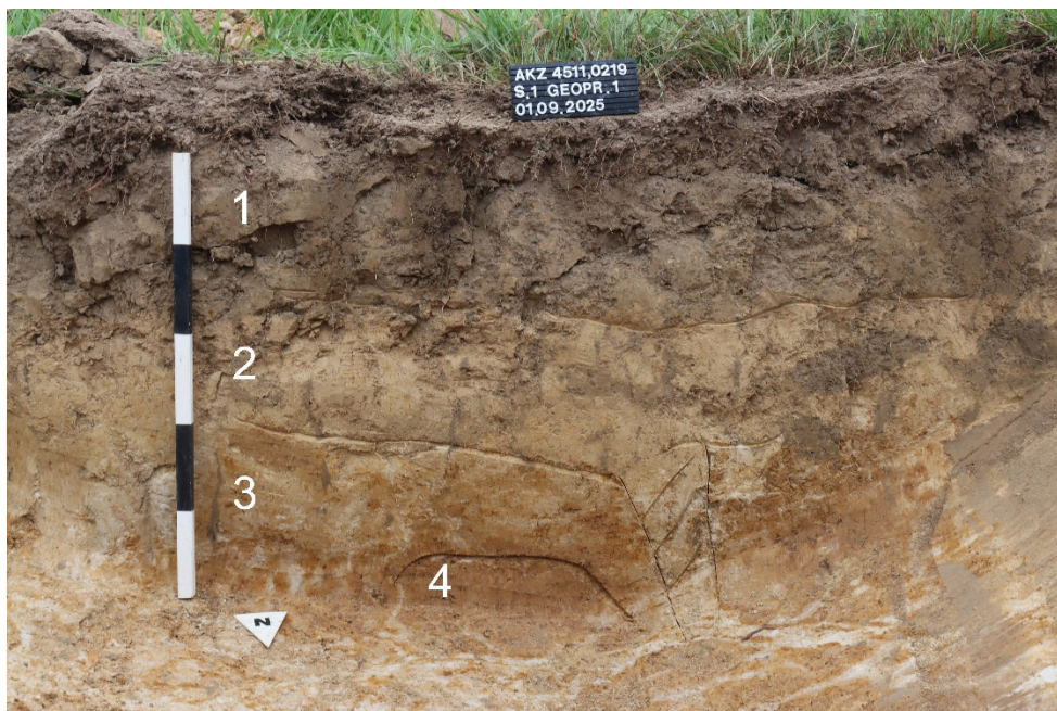
Geoprofil S1 Blickrichtung Süd