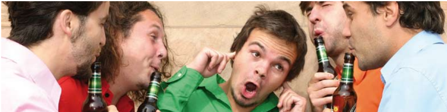
Glas-, Blas- und Singquintett, Gewinner des 21. Schwerter Kleinkunstpreises